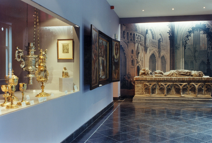
Au Trésor, une salle consacrée à Saint-Jacques